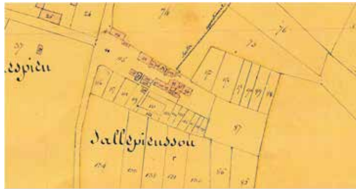
La maison dudit Alary-Roc (n°101) est sur l'emplacement de la maison de Planques, en suivant celle de Jeanne Julié (n°100) correspond à la maison Julia, puis dans la zone des maisons qui viennent d'être démolies récemment, les différentes séparations encore visibles correspondent à celle de Jeanne Julié veuve Baux (n°99) puis Marié Julié leur tante (n°97), puis la famille Accariès (n°96) non mentionnée dans cet article mais qui clôture l'espace bâti.

Le mobilier avait été réparti par moitié lors des différents contrats de mariage cependant