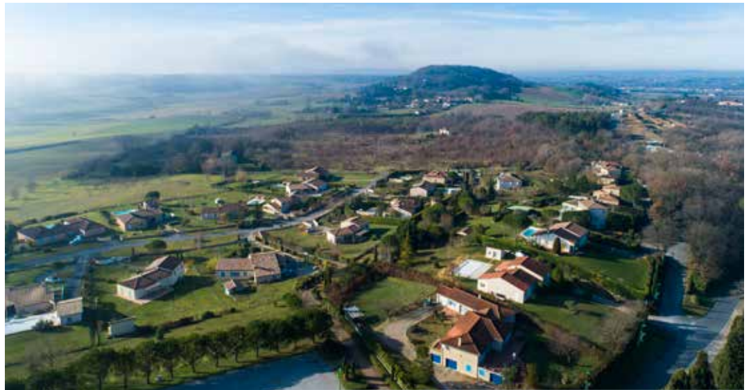
En campagne comme au centre bourg, certains noms de rue vont être modifiés

avec l'histoire du quartier ou conserve en partie le nom du lieu-dit. L'ensemble des noms de la voirie communale ont fait l'objet d'un arrêté du Maire.