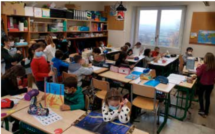
Temps de lecture pour les CP - CE.

Les élèves de CP-CE1-CE2 se déplaceront eux aussi deux fois dans l'année pour assister à des spectacles FOL. La classe des CP-CE1-CE2 participe, comme