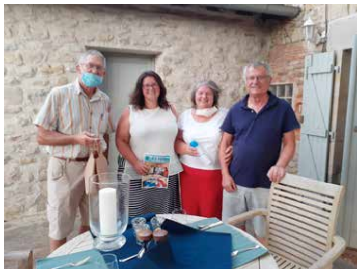
A la rencontre des personnes âgées ou fragiles.

Nous avons distribué un sachet contenant des petites bouteilles d'eau, un vaporisateur et un gel hydroalcoolique aux personnes fragiles et âgées. Ce porte-à-porte a permis de nous assurer qu'elles allaient bien et de pouvoir manifester notre soutien afin qu'elles se sentent rassurées. De plus, au cours de cette démarche les nouveaux élus ont pu se présenter.