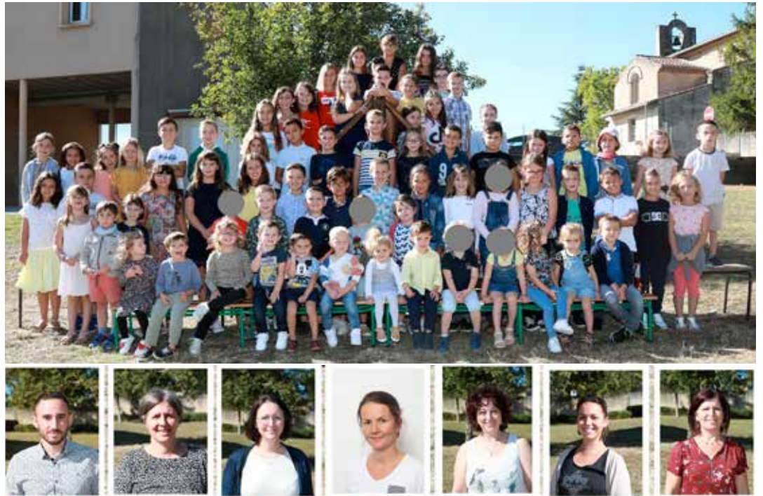
L'effectif 2020-21 et l'équipe enseignante.

avec du savon très régulier. Avec la volonté de chacun, nous y arrivons.