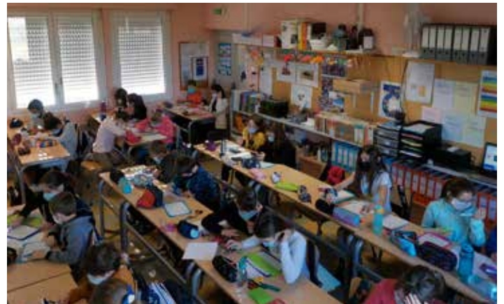
Les CM masqués au travail durant le rallye maths.