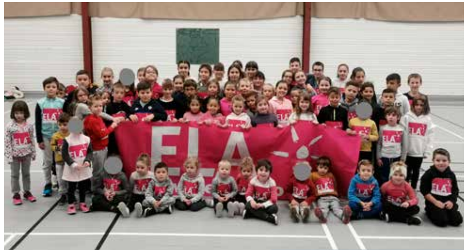
Prêts pour le cross au profit de l'opération ELA.

l'an dernier, au rallye mathématiques. Il s'agit d'un concours entre différentes classes d'un même cycle. Le but est de résoudre différents problèmes lors de trois manches réparties sur l'année scolaire. Les élèves semblent très investis dans ce projet qui leur permet de développer leurs démarches scientifiques. La première manche a eu lieu le 24 novembre.