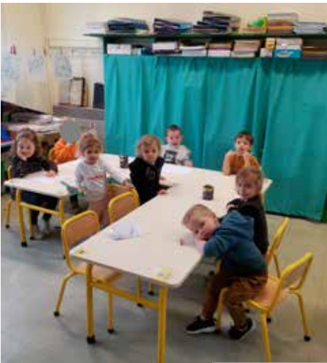
Les petites sections.