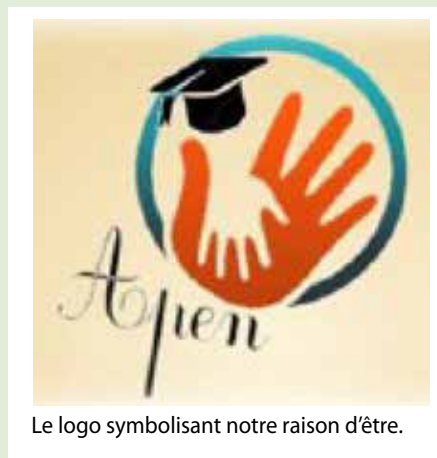
Le logo symbolisant notre raison d'être.

Le logo que nous avons imaginé et choisi pour l'APEN symbolise notre raison